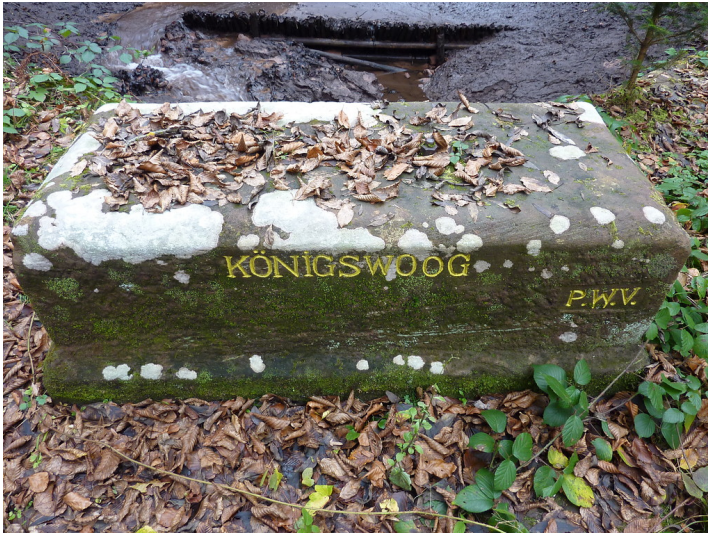
Ritterstein Nr. 56 "Königswoo" bei Merzalben (2013)