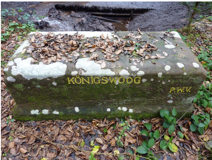
Ritterstein Nr. 56 "Königswoog" bei Merzalben (2013)