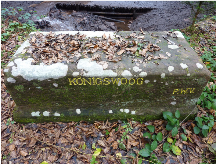
Ritterstein Nr. 56 "Königswoo" bei Merzalben (2013)