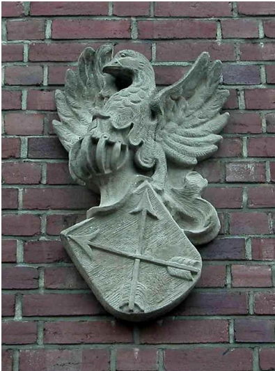
Wappen von Mauenheim an der Kirche St. Quirinus in Köln-Mauenheim (2005).