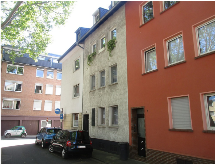
Der Standort des 1870 abgerissenen Geburtshauses des Komponisten Jacques Offenbach, Großer Griechenmarkt Nr. 1 in Köln-Altstadt-Süd (2019)