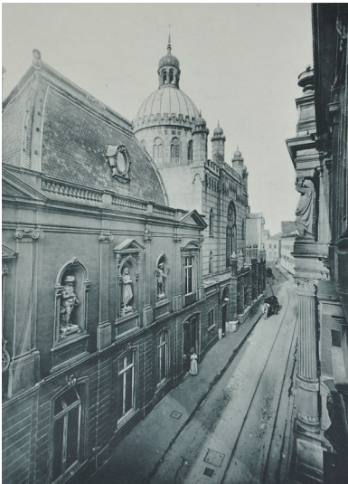
Historische Aufnahme der Kölner Synagoge in der Glockengasse (1896).