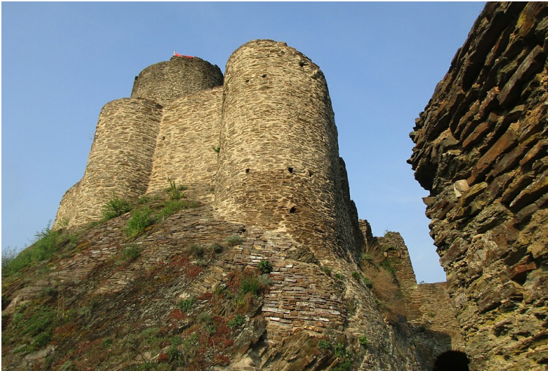
Bergfried und Mauern des oberen Burghofs der Ruine der Winneburg bei Cochem, Ansicht von Südwesten (2018).