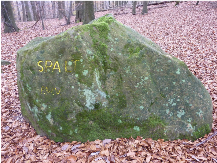
Ritterstein Nr. 55 "Spalt" bei Merzalben (2013)