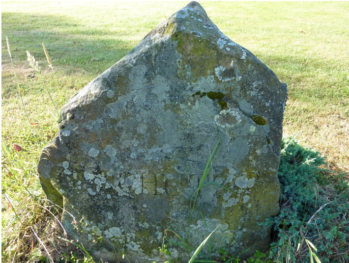
Ritterstein Nr. 53 "Geschützt" in Hermersbergerhof (2013)