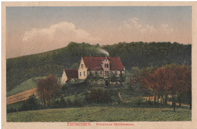
Historische Ansichtskarte des Forsthauses Heldenstein bei Edenkoben (ca. 1921).