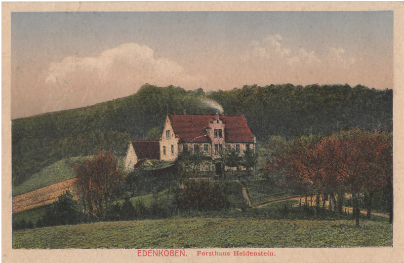
Historische Ansichtskarte des Forsthauses Heldenstein bei Edenkoben (ca. 1921).