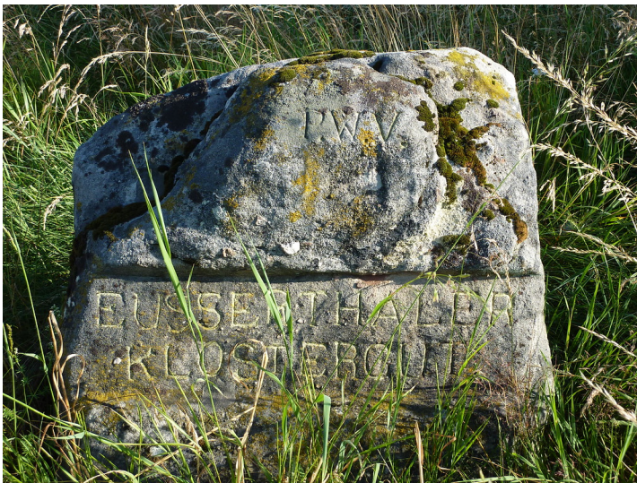
Ritterstein Nr. 52 "Eusserthaler Klostergut" in Hermersbergerhof (2013)