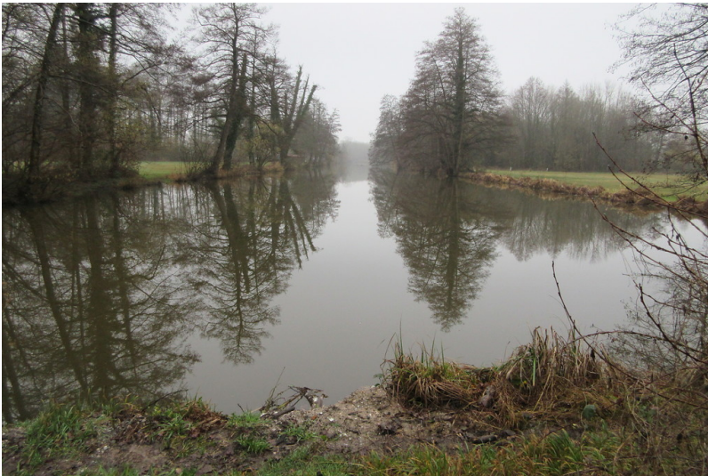
Panzergraben-Relikt des Westwalls in Schaidt (2018)