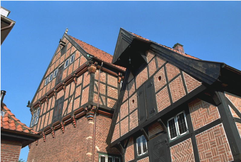
Altes Rathaus (Hintergrund) und Speicher (Vordergrund) (2007)