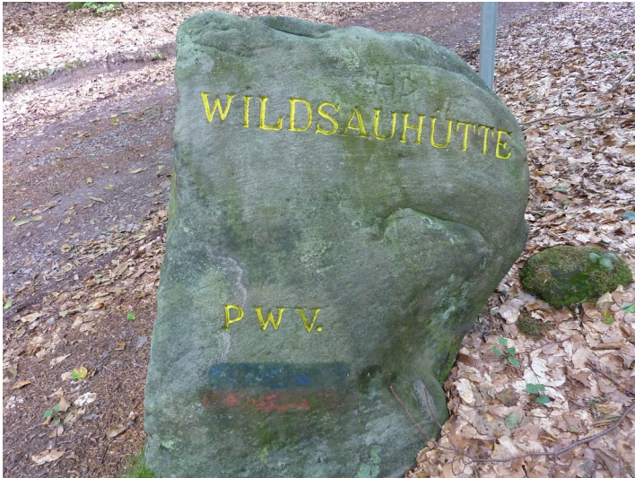
Ritterstein Nr. 50 "Wildsauhütte" am Hanseck (2013)