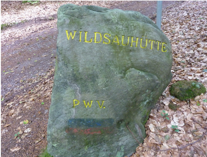
Ritterstein Nr. 50 "Wildsauhütte" am Hanseck (2013)