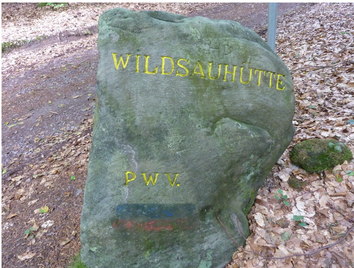
Ritterstein Nr. 50 "Wildsauhütte" am Hanseck (2013)