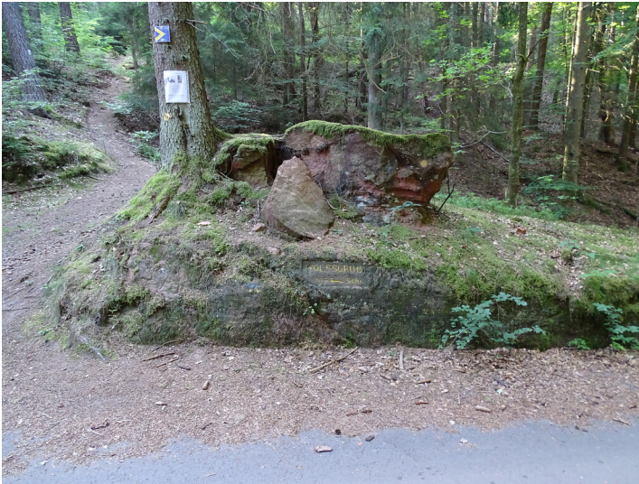
Ritterstein Nr. 48 Wolfsgrub 105 Schr. bei Wilgartswiesen (2020)