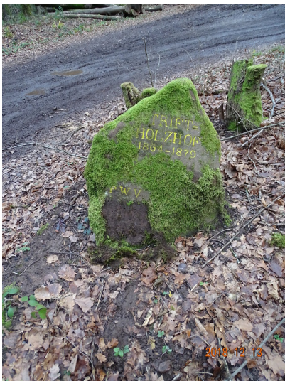
Ritterstein Nr. 1 Trift=Holzhof 1864-1879 an der Siebenteilbrücke (2018)