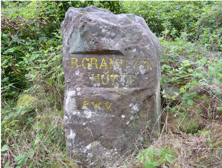
Ritterstein Nr. 40 R. Granitzenhütte im Horbachtal (2013)