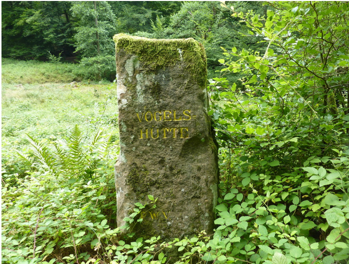
Ritterstein Nr. 38 "Vogelshütte" bei Hinterweidenthal (2013)