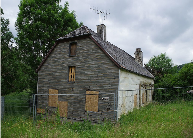
Die Alte Gerberei Hellenthal, auch "Haus Krämer" bzw. "Gerberei Matheis" genannt, Ansicht der Nordostseite (2017).