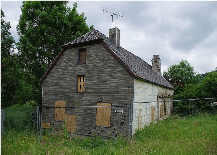
Die Alte Gerberei Hellenthal, auch "Haus Krämer" bzw. "Gerberei Matheis" genannt, Ansicht der Nordostseite (2017).