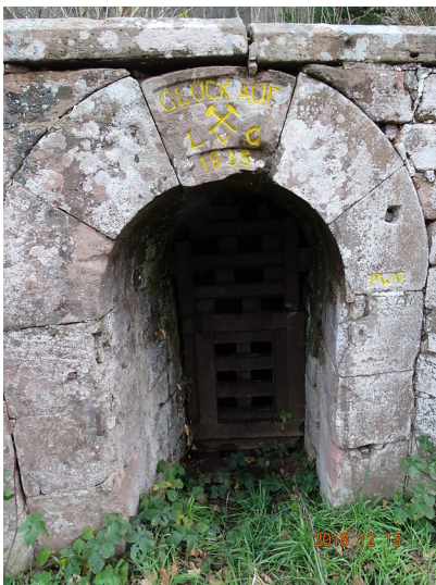
Ritterstein Nr. 22 Glück Auf L v G 1835 am Forsthaus Erzgrube bei Niederschlettenbach (2018)