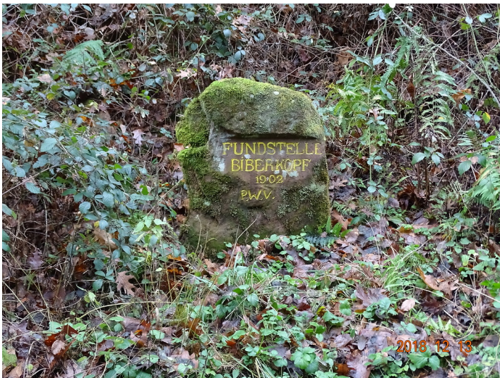
Ritterstein Nr. 17 "Fundstelle Biberkopf 1902" bei Niederschlettenbach (2018)