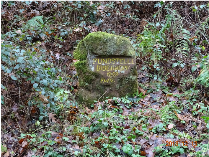
Ritterstein Nr. 17 "Fundstelle Biberkopf 1902" bei Niederschlettenbach (2018)