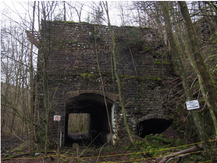
Brecheranlage Felsenthal: Ansicht von Norden mit den beiden Ladetunneln. (2018)