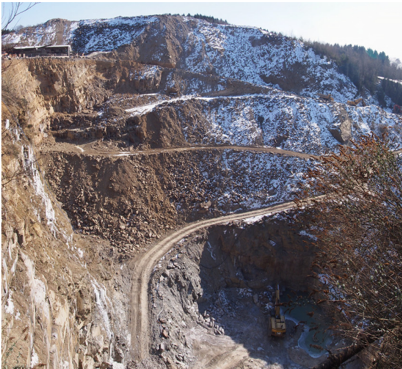
Steinbruch Fa. Quirrenbach, Lindlar: Blick von der Straße in den Bruch. (2018)