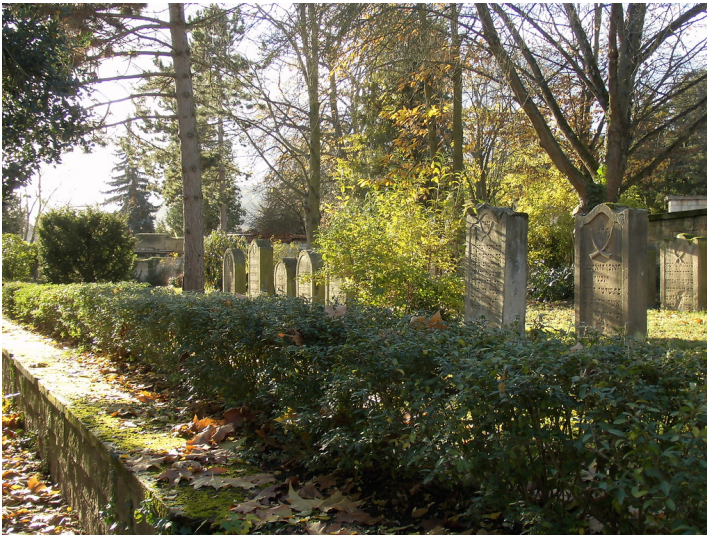
Jüdischer Friedhof Deidesheim (2017)