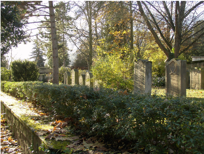
Jüdischer Friedhof Deidesheim (2017)