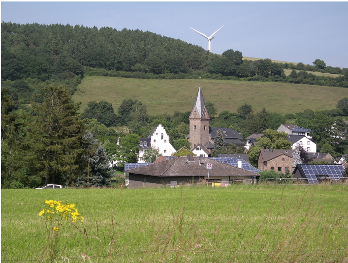
Dorf Kallmuth (2018)