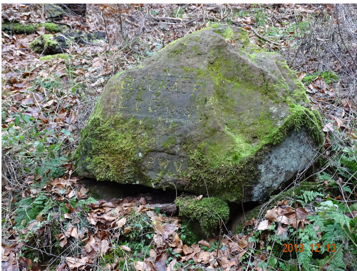
Ritterstein Nr. 10 Glückauf L. v. G. 1838 bei der Eisenerzgrube St.-Anna-Stollen bei Nothweiler (2018)