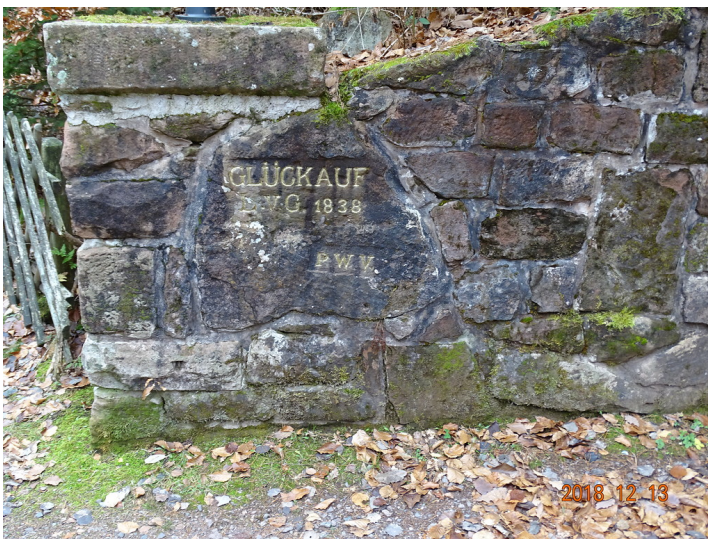
Ritterstein Nr. 9 Glückauf L. v. G. 1838 an der Eisenerzgrube St.-Anna-Stollen bei Nothweiler (2018)