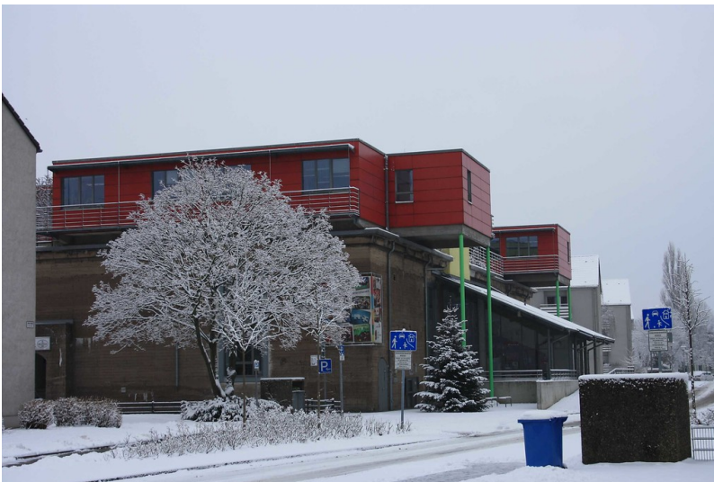
Hochbunker in Oberhausen, heute Bürgerzentrum und Bunkermuseum Oberhausen (2010)