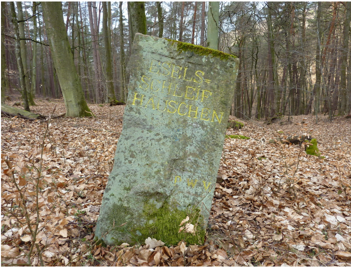
Ritterstein Nr. 5 "Eselsschleif Häuschen" bei Bobenthal (2013)