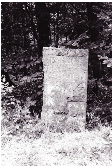
Ritterstein Nr. 5 "Eselsschleif Häuschen" nördlich vom Probstberg (1993)