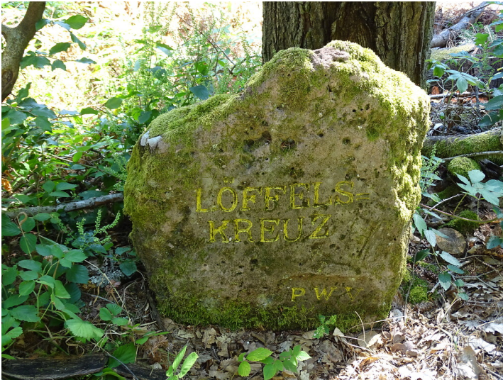
Ritterstein Nr. 03 Löffels-Kreuz am Probstberg (2020)