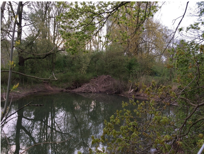
Biberburg Moiedtjes Teiche (2017)