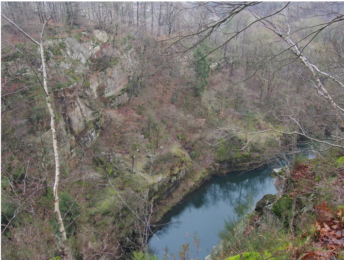
Blick von oben in den Bruchkessel: See im Steinbruch Remshagen Süd. (2018)