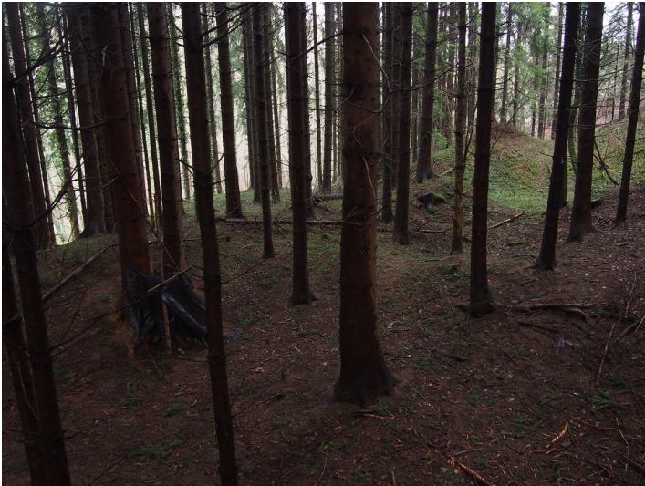
Steinbruch Steinbach 1: Das Areal ist bewaldet (Fichten). (2018)