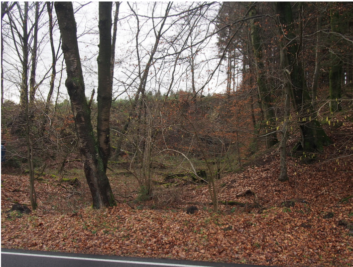
Blick von der Straße in den Steinbruch. (2018)