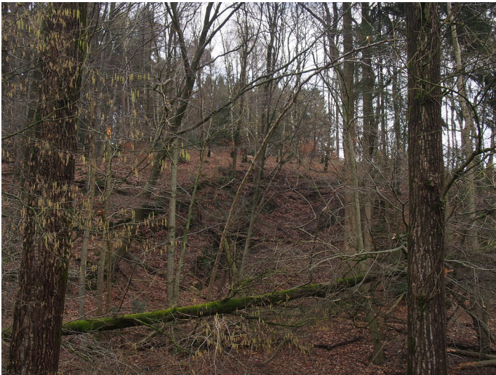
Steinbruch Oberfeld: An der linken Bruchflanke sind Felsrippen zu erahnen. (2018)