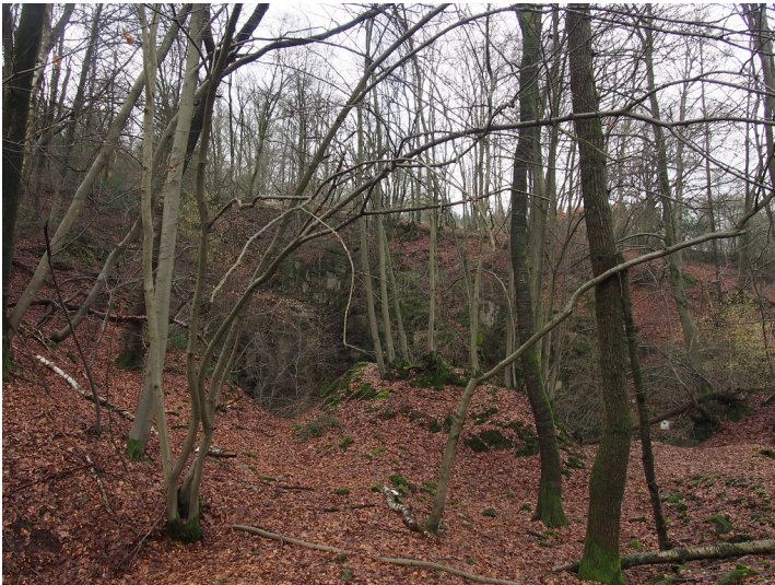
Alte Bruchefahrt des Steinbruchs bei Zäunchen. (2018)