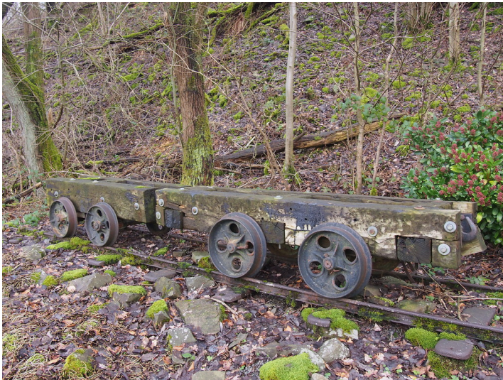
Hunten für Rohblöcke am Steinbruch Unterlichtinghagen 1. (2018)