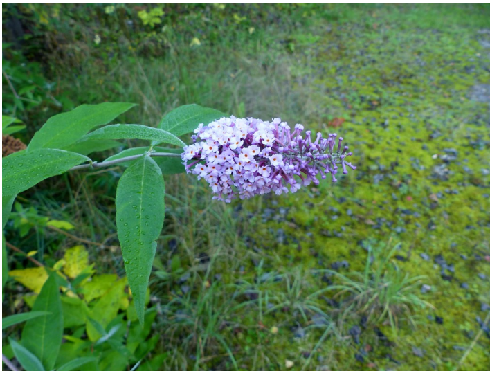
Schmetterlings-Flieder im Dolomitsteinbruch Pack bei Lindlar-Linde (2018)