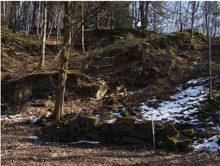
Östliche Bruchflanke Steinbruch Wolfsschlade bei Lindlar. (2018)