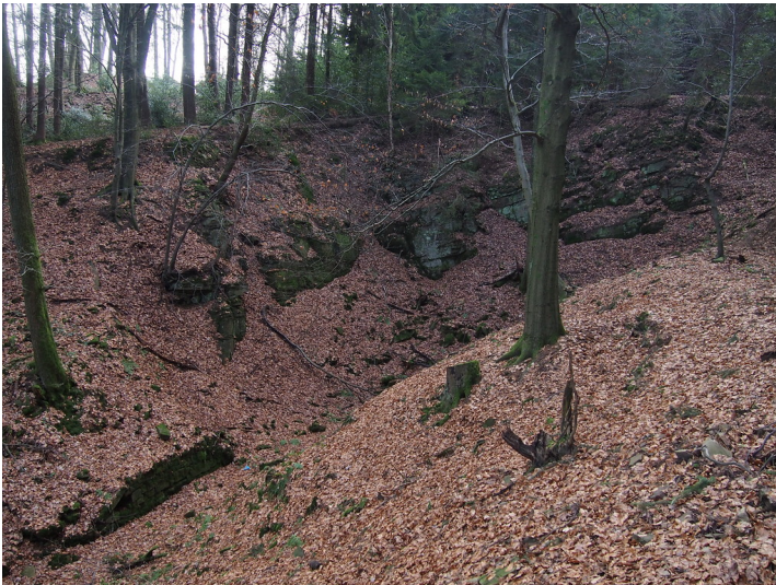
Blick von oben in den Bruch Würden 3. Unten links in der Einfahrt sichert eine Mauer die Einfahrt. (2018)