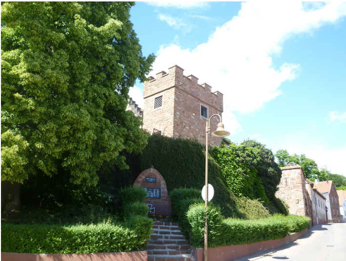
Südwestansicht des Glockenturms von Stauf. Im Vordergrund ist ein Weltkriegsdenkmal am Straßenrand zu sehen (2011).