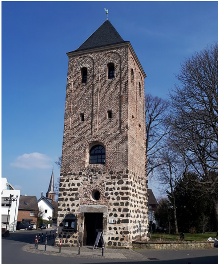
Der "Alte Turm" in Niederkassel-Lülldorf, verbliebener Kirchturm der 1880 abgerissenen St. Jakobus Pfarrkirche (2018).