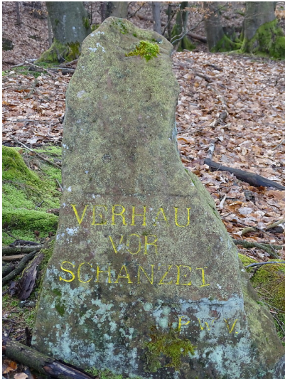
Ritterstein Nr. 66 Verhau vor Schanze I am Steigerkopf (2018)