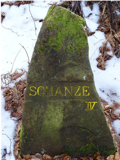
Ritterstein Nr. 65 Schanze IV am Steigerkopf (2018)