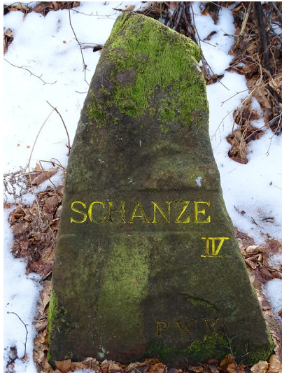
Ritterstein Nr. 65 Schanze IV am Steigerkopf (2018)