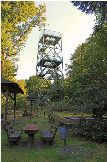
Selbergturm auf dem Selberg bei Rothselberg (2010)